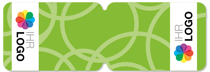
Ansicht des fertigen PocketCleaner®