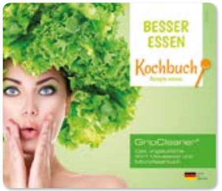
Ansicht des fertigen GripCleaner®

* Diese Angaben sind Pflichtangaben. Sie dürfen aufgrund der Textilkennzeichnungsverordnung nicht entfernt werden.